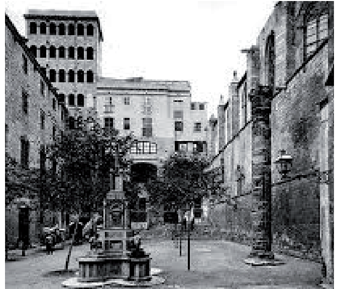
2. Plaça del Rei, foto de finals del segle XIX, quan encara hi ha una de les columnes del temple romà de Barcelona, que després va ser trasllada al pati del Centre Excursionista de Catalunya