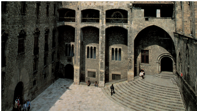
1. Plaça del Rei. Porta de Santa Àgueda, al fons al cap de munt de l'escala, per on tingué entrada l'Acadèmia de Medicina, durant alguns anys de la primera meitat del segle XIX.