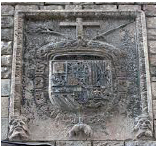
3. Escut de la Inquisició, a la façana del Museu Marés, també porta d'entrada al Palau del Lloctinent, que forma part d'aquest conjunt monumental, ara seu de l'Arxiu de la Corona d'Aragó.