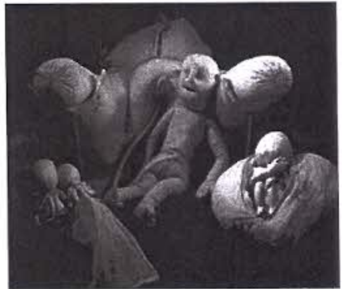
Fotografia parcial del maniquí (La "Machine") de Mme. du Coudray