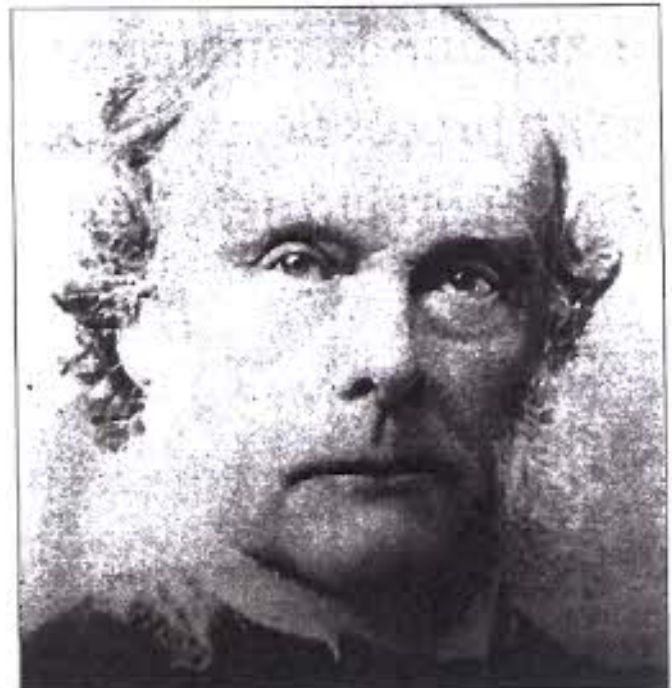
Joseph Lister (1827-1912)