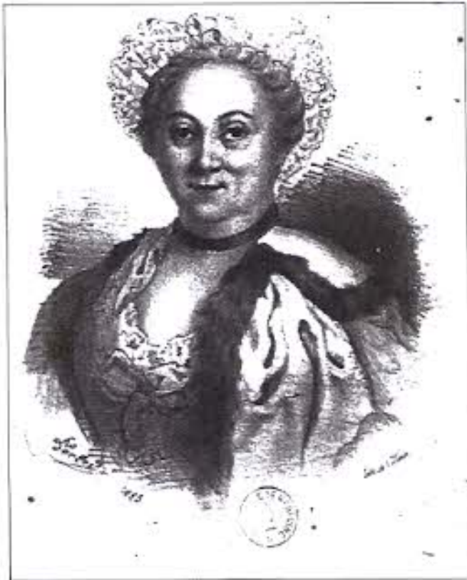
Madame du Coudray (1714-1789)

Aquí calia donar notícia de l'obra excepcional d'una dona occitana que va revalorar la pràctica de l'assistència als parts, fent cursos itinerants per gairebé tot França durant un quart de segle, ensenyant els rudiments imprescindibles de l'obstetrícia a milers de dones, i molts cirurgians. Sembla que va contribuir a millorar el resultat dels parts, baixant la mortalitat infantil en el medi rural. Després l'assistència va ser feta més sovint per cirurgians, més en parts difícils, o en ciutats, però el nivell global d'assistència havia millorat. Mme du Coudray va néixer a l'Àlvèrnia, va morir a Bordeus, tot en terres occitanes, molts dels seus cursos els va fer també en terres del que se'n digué "midi", encara que el control, els permisos i la subvenció arribaven de París.