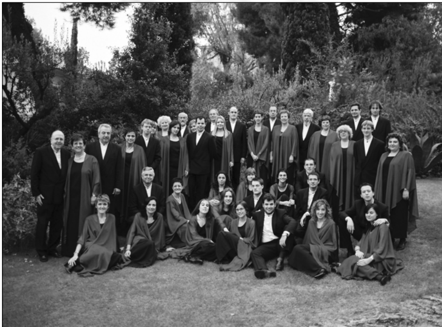
Coral Polifònica de Puig-reig