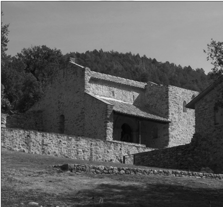
Sant Quirze de Pedret.

ATENCIÓ: el punt de trobada per a l'inici de les sortides és la recepció de l'hotel Berga Park. Els autocars surten de davant l'hotel i tornen al mateix lloc.