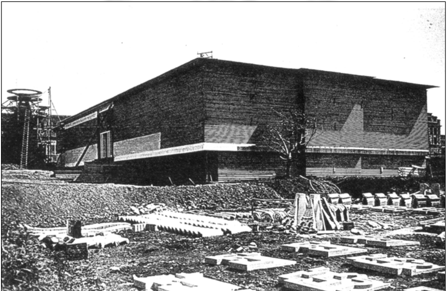
Pavelló de Suècia en construcció. La Torre es pot veure al fons a mà esquerra.