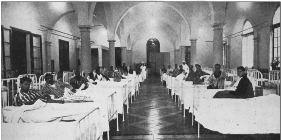
Sala de ferits de l'hospital número 18. Barcelona.

Un record de Francesc Duran Reynals als 50 anys de la seva mort.