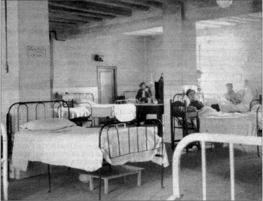
Sala d'homes de l'Hospital Sant Bernabé de Berga.