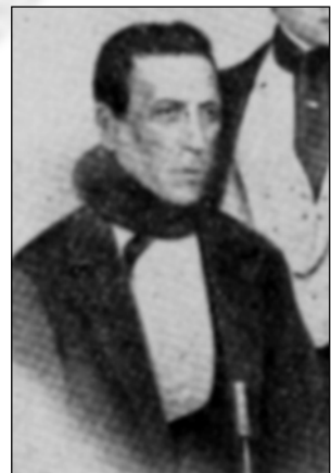
A la dreta: Josep de Storch i Pla (Berga, 1789- Madrid, 1880)