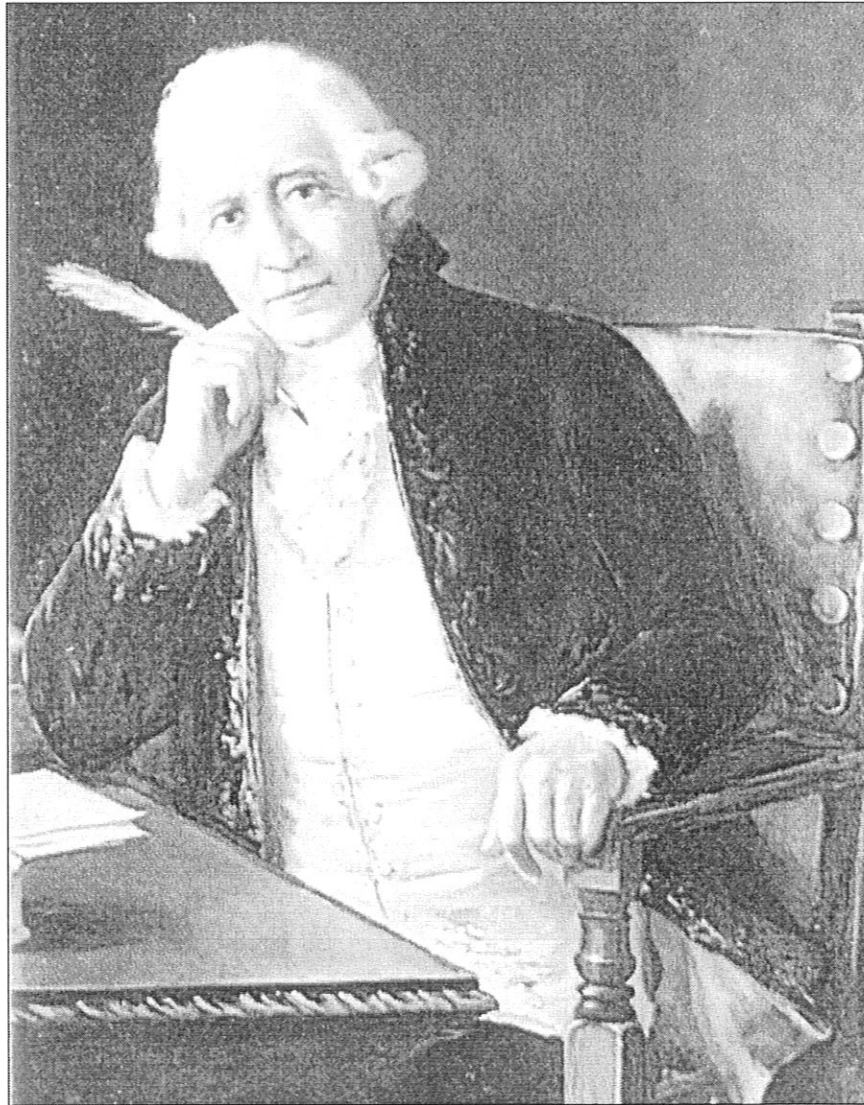
Francesc Salvà i Campillo