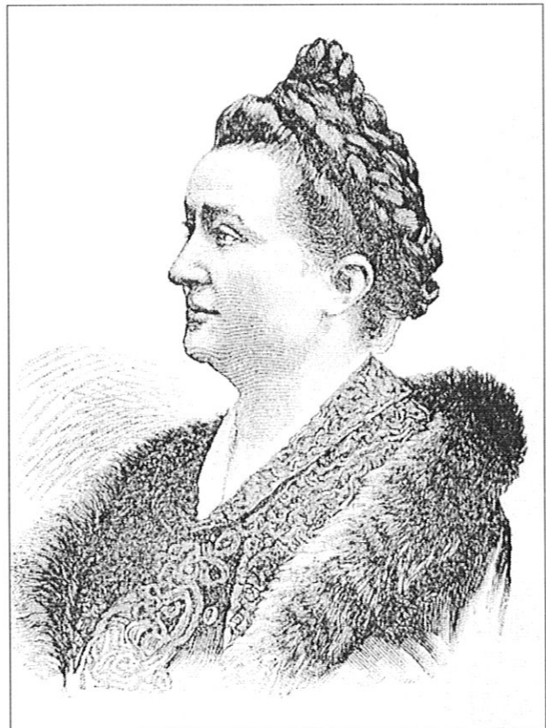
Madeleine Brès (1842-1921)