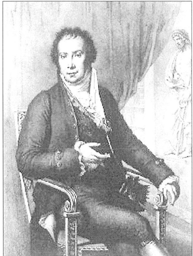
Jean Louis Alibert (1768-1837)