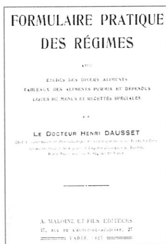
Portada de «Formulaire Pratique des Régimes»